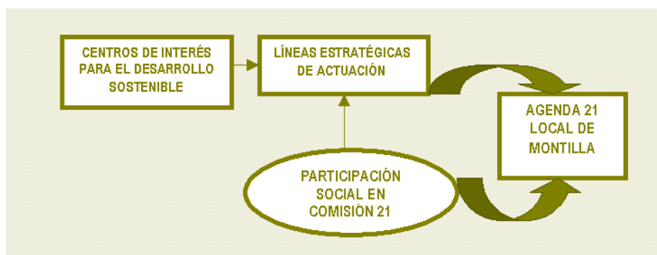
Gráfico 4: Proceso de definición de la Propuesta de Agenda 21 Local de Montilla

Estas conclusiones ponen de relieve la existencia de determinados Centros de Interés hacia el Desarrollo Sostenible en el municipio, sobre los que deberá intervenir desde la Agenda 21 Local de Montilla. Son por lo tanto la base para el establecimiento de las Líneas Estratégicas, Programas y Proyectos que integrarán el Plan de Acción.