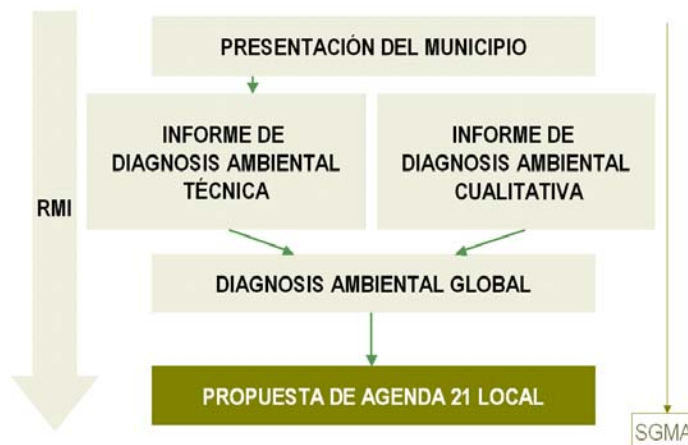
Gráfico 2: Fases de la Revisión Medioambiental Inicial (RMI)

La aplicación a lo largo de diez meses de trabajo de la metodología descrita ha permitido obtener un conocimiento profundo de la situación actual de los factores ambientales, socioeconómicos y organizativos del municipio, y la definición de un Plan de Acción asumido y consensuado por todos los Agentes Sociales que sirva de base para definir un modelo de Desarrollo Sostenible. Comienza ahora un proceso actuación, en el que la participación de todos los agentes implicados, y la voluntad de mejora continua deben cobrar papeles protagonistas para que el Plan de Desarrollo Sostenible que ahora se propone, tenga garantías de éxito.