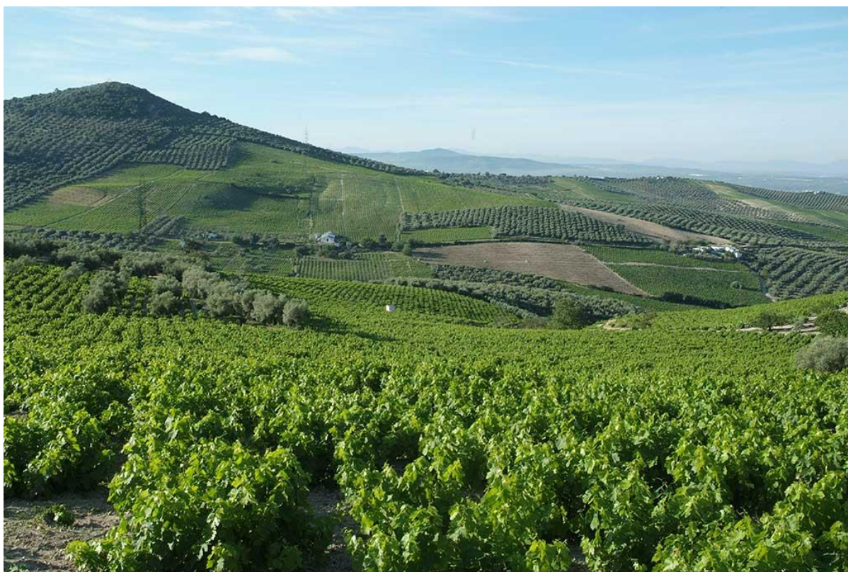
Cerro de Don Juan en la Sierra de Montilla.

Por ese motivo, se propone abordar la adaptación al cambio climático en materia de Agricultura a través de la línea estratégica orientada a fomentar la conservación del suelo y los servicios ecosistémicos de cara a que estos contribuyan a mitigar los impactos del cambio climático y prevenir los riesgos de inundación en zonas agrícolas.