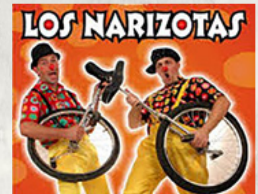
LOS NARIZOTAS Sábado 02/05 En La Silera 19:00 H.

19:00 H Actuación Musical Infantil "Los Narizotas"