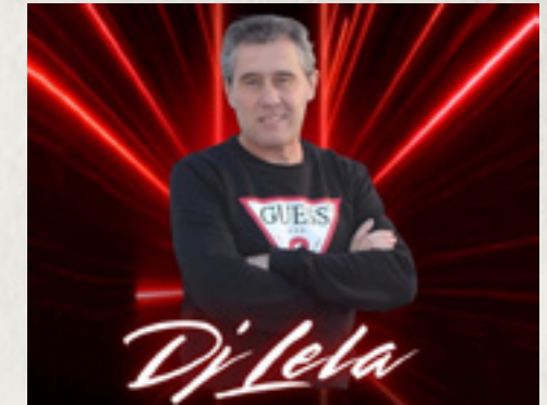
DJ Lela Sábado 2/05 Llanete de La Cruz 00:30 H.