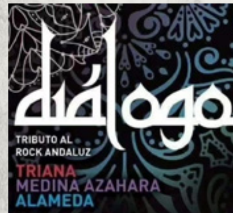
Diálogo Sábado 2/05 Llanete de la Cruz 22:30 H.